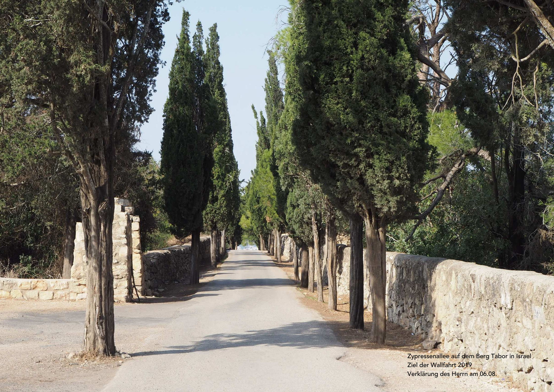
Zypressenallee auf dem Berg Tabor in Israel Ziel der Wallfahrt 2019 Verklärung des Herrn am 06.08.