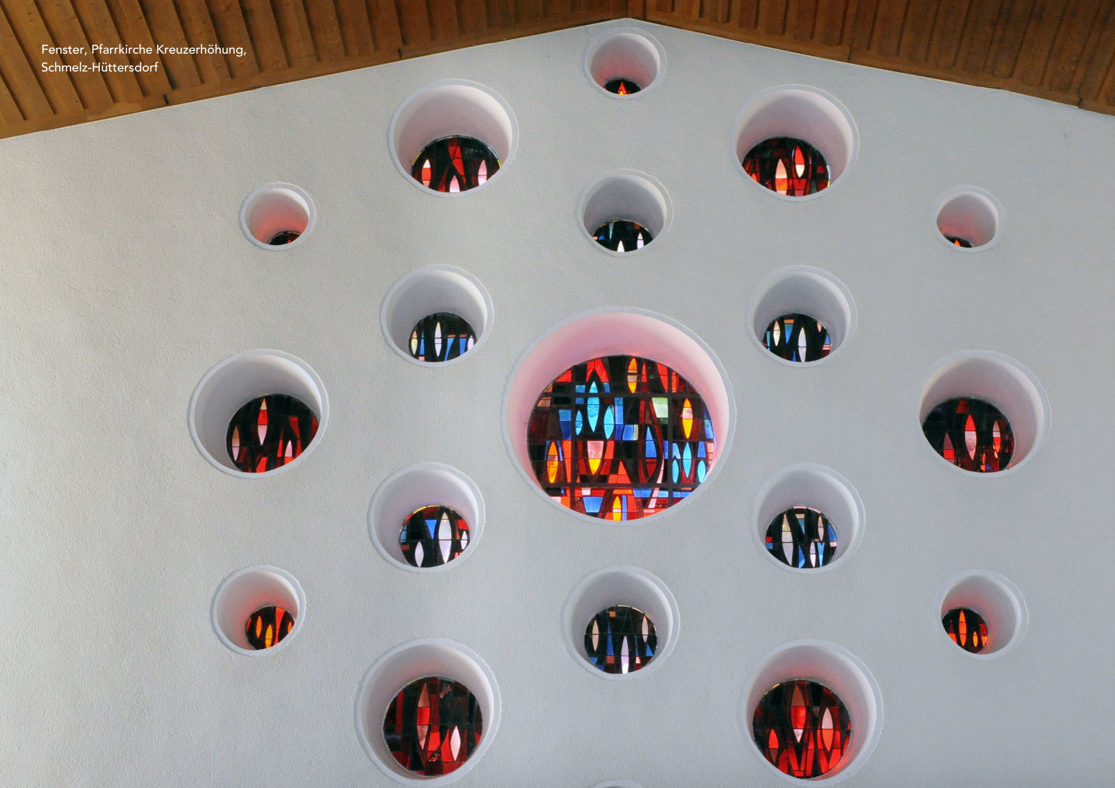
Fenster, Pfarrkirche Kreuzerhöhung, Schmelz-Hüttersdorf