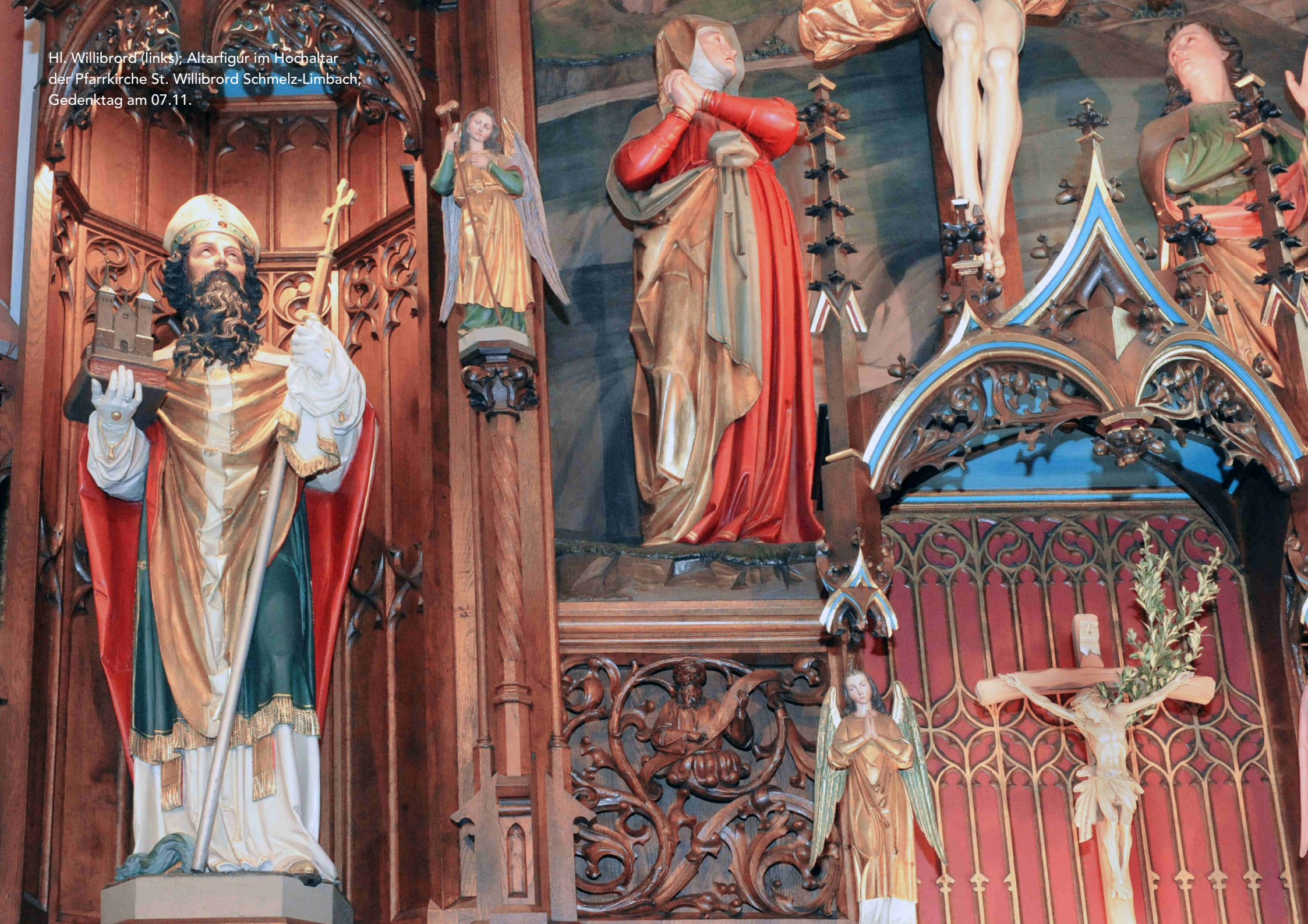
Hl. Willibrord (links); Altarfigur im Hochaltar der Pfarrkirche St. Willibrord Schmelz-Limbach; Gedenktag am 07.11.