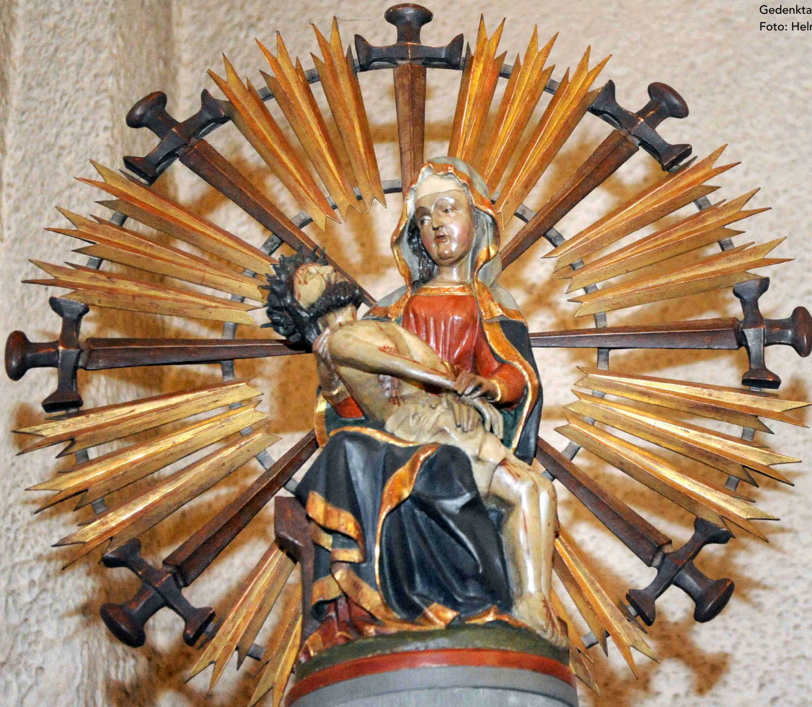
Sieben Schmerzen Mariens, Pfarrkirche St. Marien in Schmelz-Außen Gedenktag am 15. September