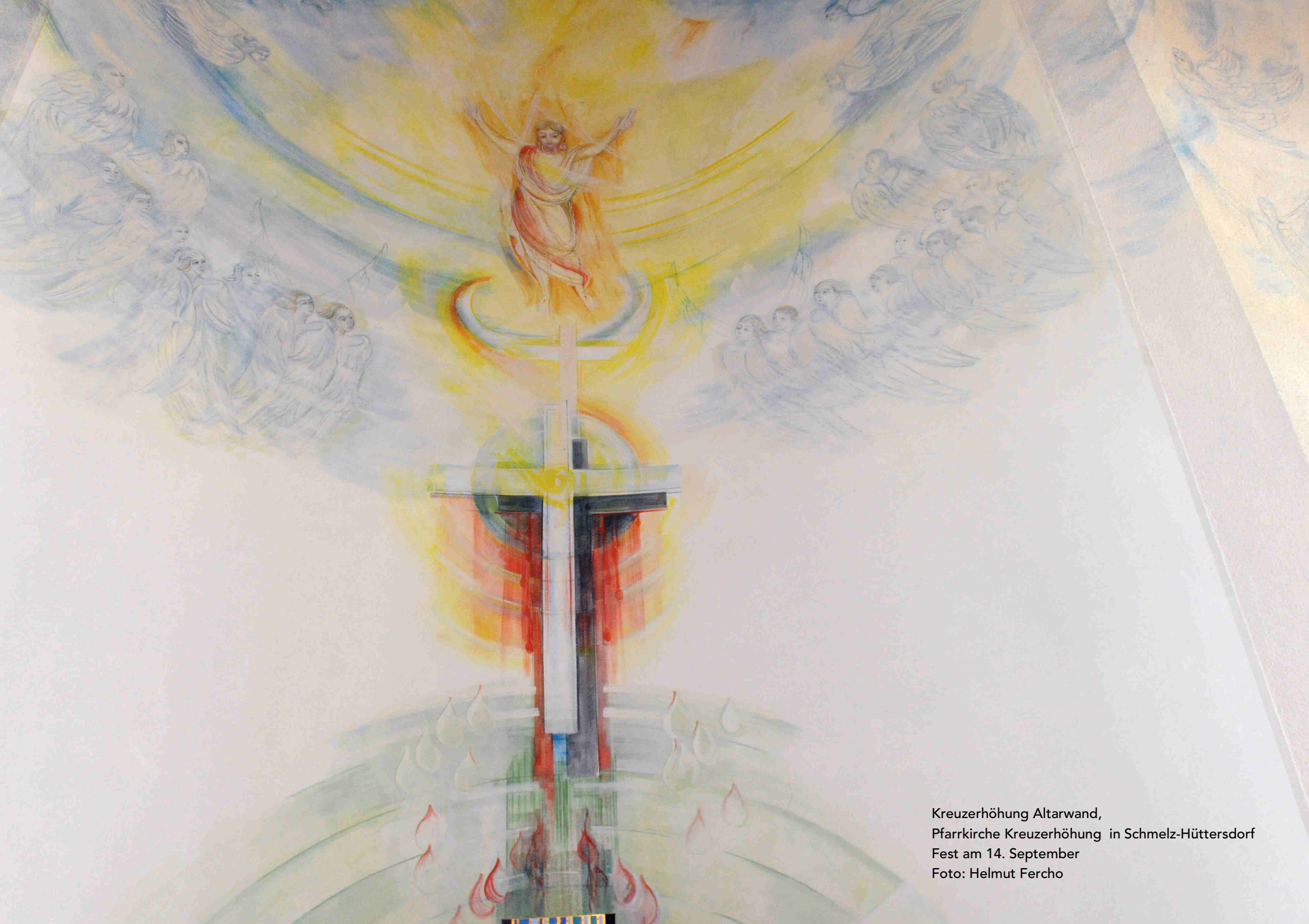
Kreuzerhöhung Altarwand, Pfarrkirche Kreuzerhöhung in Schmelz-Hüttersdorf Fest am 14. September