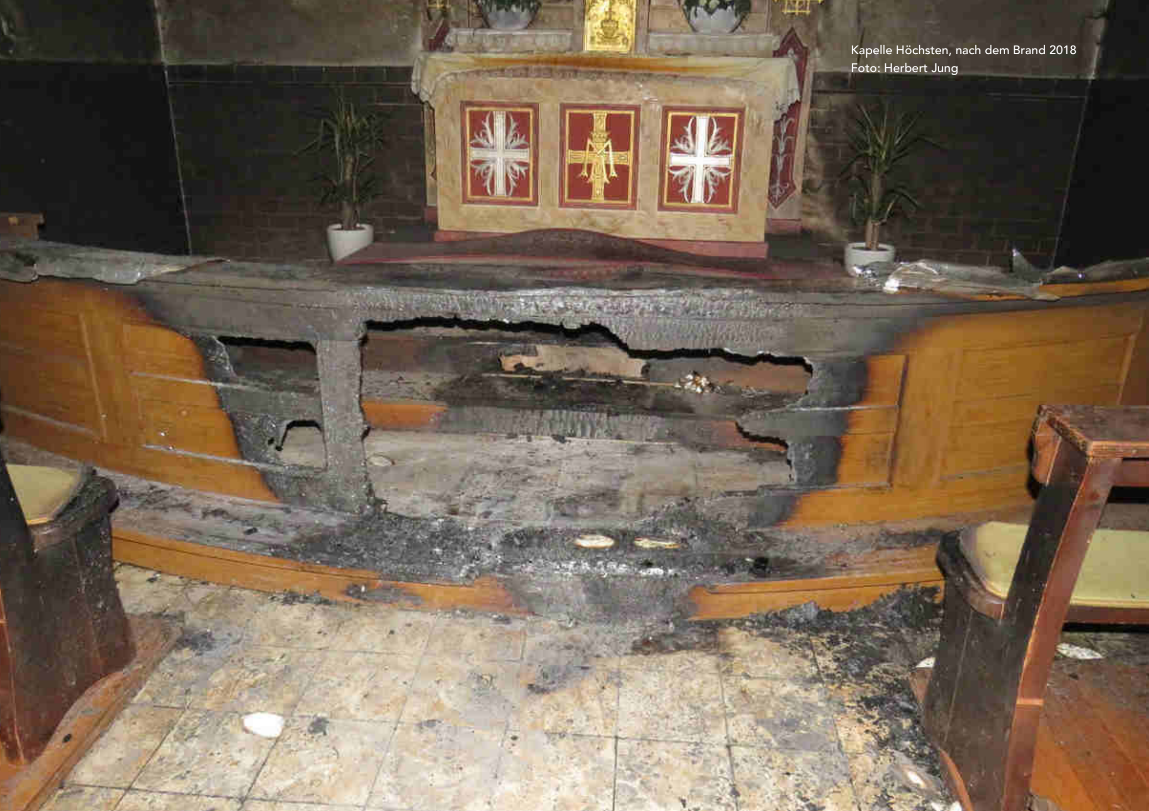
Kapelle Höchst, nach dem Brand 2018