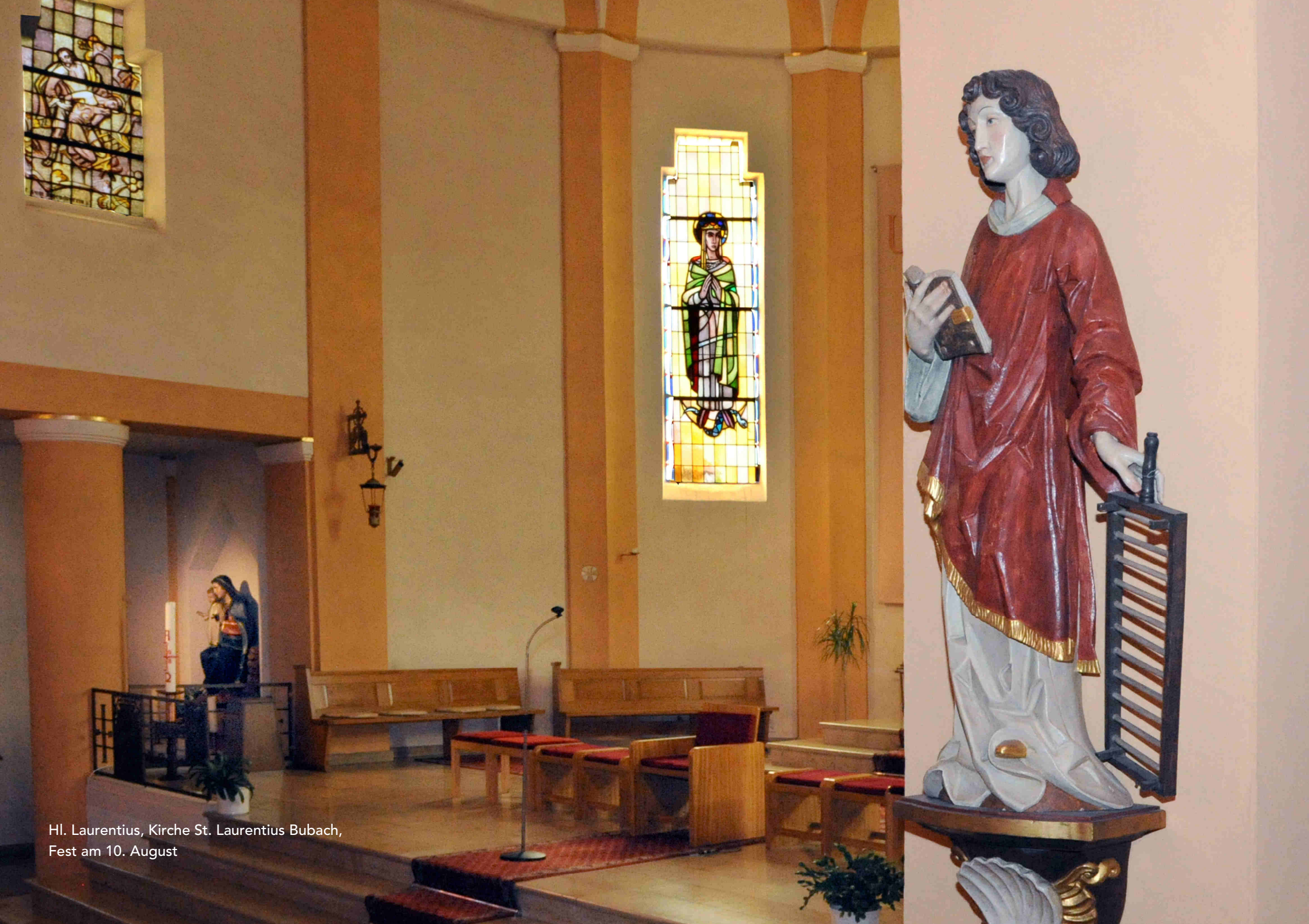
Hl. Laurentius, Kirche St. Laurentius Bubach, Fest am 10. August