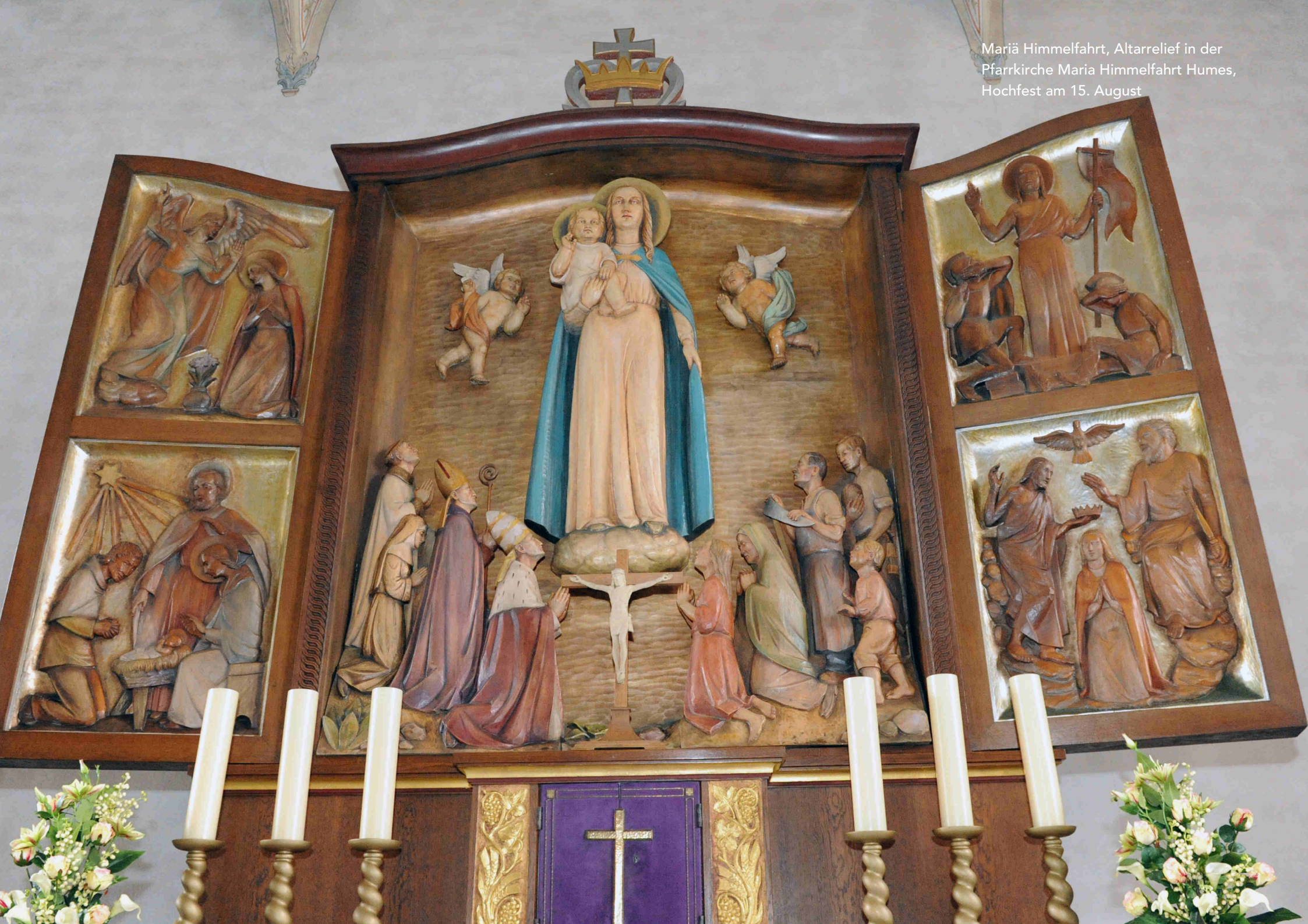
Mariä Himmelfahrt, Altarrelief in der Pfarrkirche Maria Himmelfahrt Humes, Hochfest am 15. August